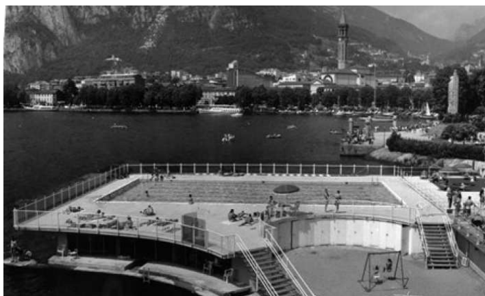
La sede della Canottieri Lecco in una foto d'epoca

Si è tenuto sabato 14 Marzo un convegno su "Sport e industria", organizzato nell'ambito delle manifestazioni dedicate ai 120 anni della fondazione della Canottieri Lecco. Molte le autorità presenti all'incontro