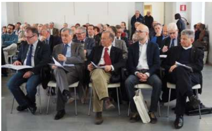
Un momento del convegno

Canottieri Lecco, continua il sindaco: “se quest’oggi siamo a Lecco a inaugurare i lavori dell’assemblea nazionale ordinaria dell’Unasci è grazie alla nostra Canottieri Lecco, una società motivo di orgoglio e