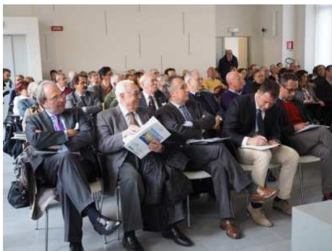
Un altro momento della giornata di sabato