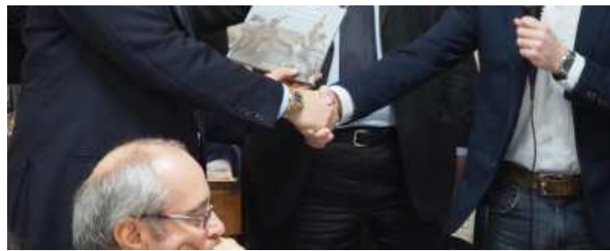
Un altro momento del convegno

racconto ha descritto le innovazioni tecnologiche legate allo sport derivanti dalle ricerche effettuate dal Polimi, facendo una breve sintesi delle attività che,